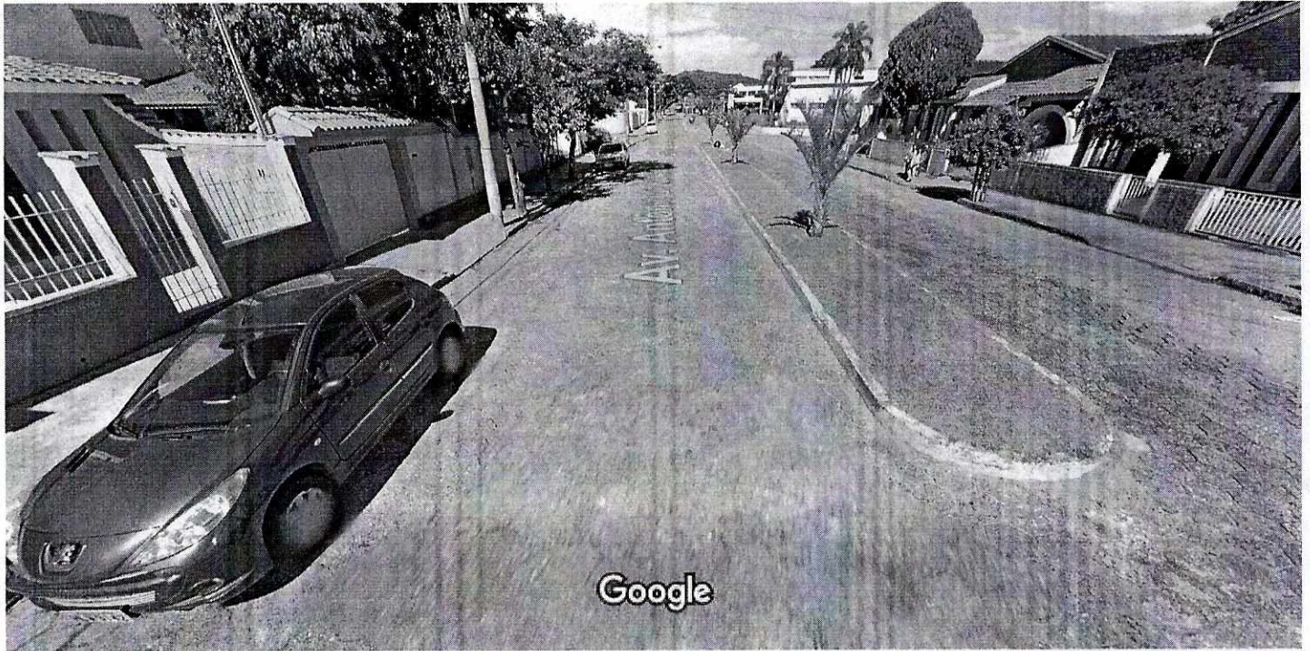
Captura da imagem: mai 2015