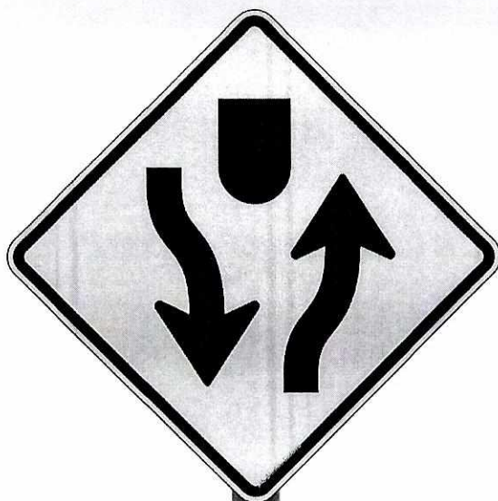
A-42a Início de pista dupla